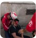
Photo #2 👁️ Vérification: Investigation Lemurjaune.fr

👁️ Vérification: Investigation Lemurjaune.fr