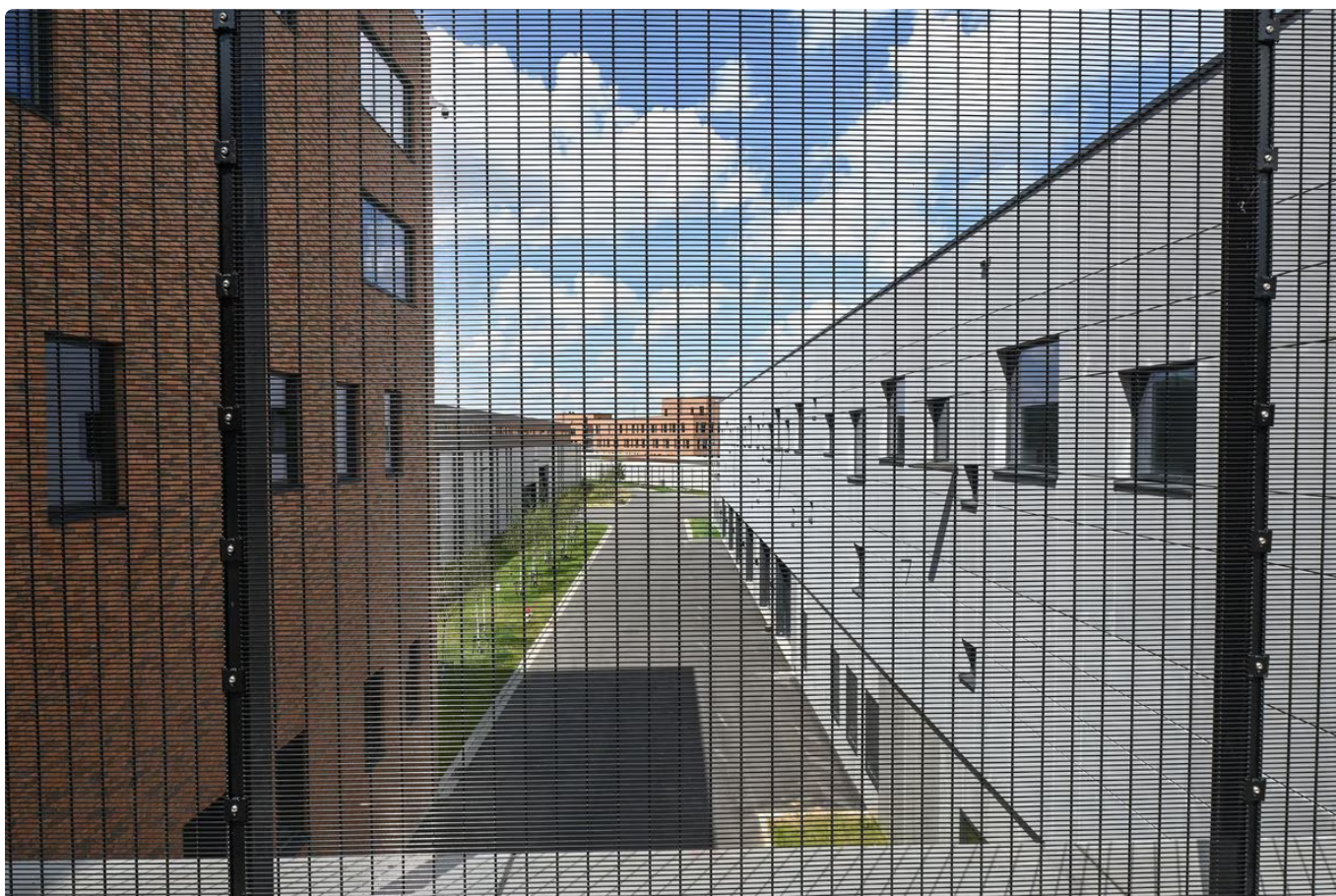
Village pénitentiaire de Haren

Publié le 20-07-2023 à 19h48 - Mis à jour le 20-07-2023 à 19h49